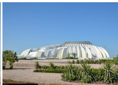
Pavillon de l'Emir

Parmi les réalisations les plus emblématiques conçues par les architectes et ingénieurs d'ADPI figurent :