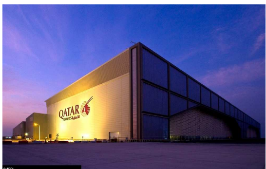
Centre de maintenance avions de Qatar Airways

Par ailleurs, ADPI a assisté Bechtel Group (en charge de la supervision des travaux) lors de la phase de supervision de la construction et a géré la reconfiguration de l'espace aérien Qatari, lequel accueille environ 360.000 mouvements d'avions par an.