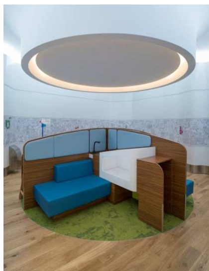
Espace Babyroom ©ADP – Alain Leduc.

Il s'agit d'un service gratuit destiné aux familles avec enfants en bas âge. Aéroports de Paris a souhaité leur offrir un espace pour faire dormir leurs enfants avant leur vol. Cette pièce propose ainsi 4 berceaux en accès libre, coupés du bruit de la salle d'embarquement. Des assises pour les parents complètent cet aménagement. Des équipements pour réchauffer le repas de bébé : micro-onde, chauffe biberons et évier pour nettoyer son matériel sont également disponibles.