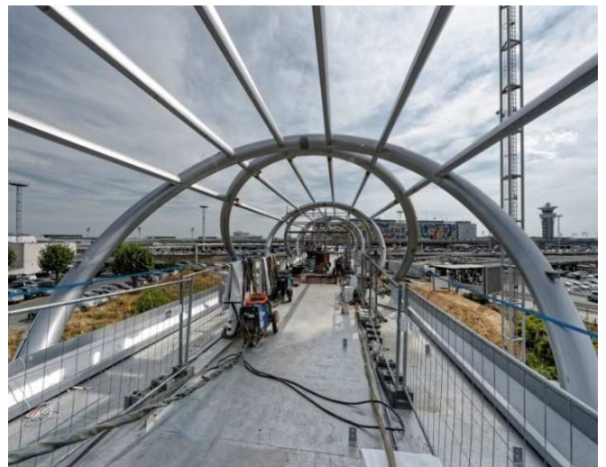
Intérieure de la passerelle en construction

La majorité des tubes ont été forgés sur le site Vallourec d'Aulnoye-Aymeries (Nord de la France) selon le procédé breveté unique au monde « Premium Forged Pipes® », bénéficiant ainsi du savoir-faire industriel reconnu du Groupe.