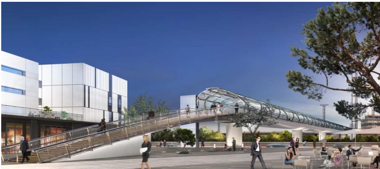
Vue de la passerelle depuis l'esplanade du quartier Cœur d'Orly

Conçue comme un ouvrage d'art, une passerelle reliera d'ici au printemps 2017 le terminal Sud de l'aéroport Paris-Orly au quartier d'affaires Cœur d'Orly en cours de développement. Elle permettra également une liaison avec la future gare multimodale de l'aéroport qui doit accueillir en 2024 les lignes 14 et 18 du métro du Grand Paris. Dotée d'une esthétique futuriste et de parois transparentes, l'ouvrage cumule des caractéristiques hors-normes pour une passerelle : 800 tonnes de charpente métallique, 200 tonnes de vitrages, 270 mètres de longueur pour 7,5 mètres de largeur et 5,5 mètres de hauteur.